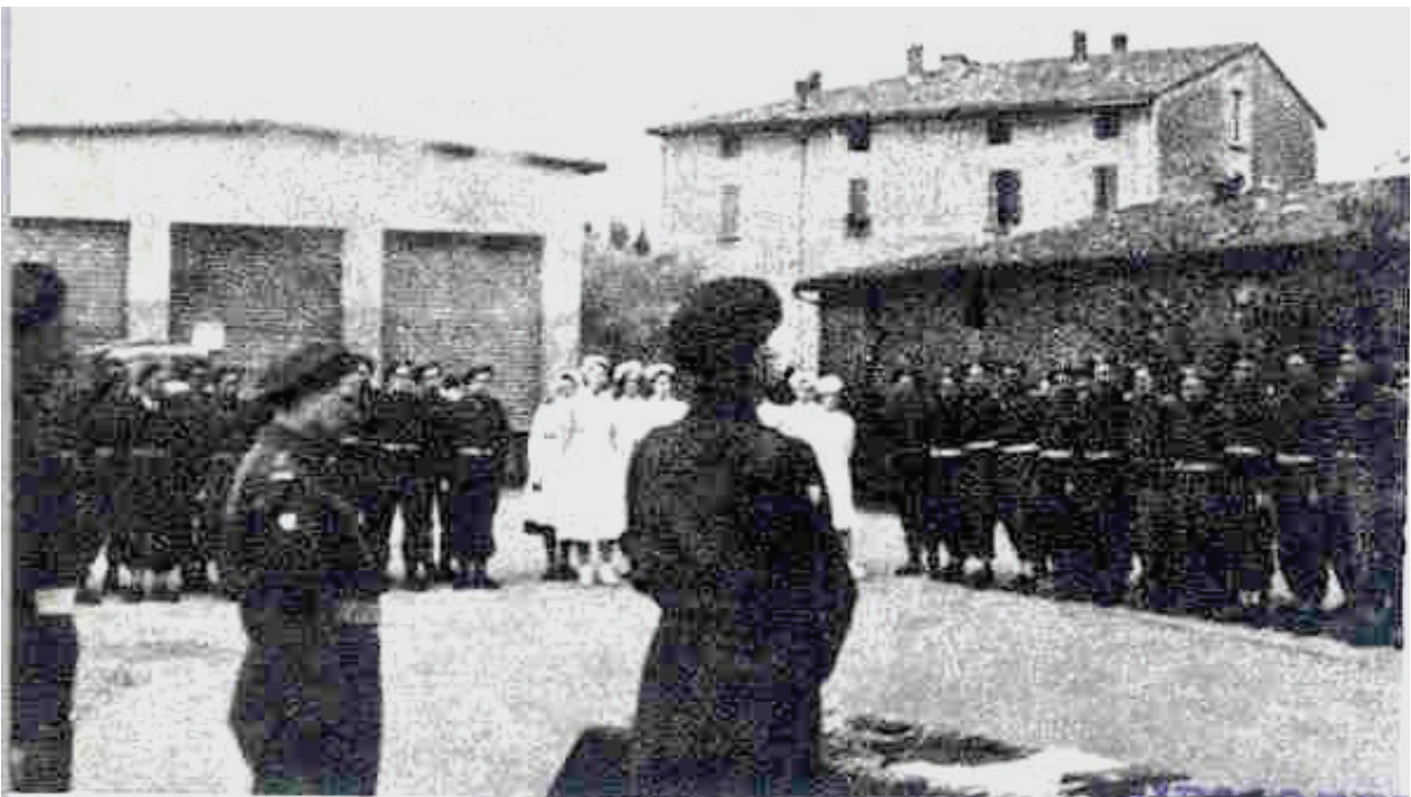
Fot. 9: Gen. Szarecki przemawia do personelu 3 Sanitarnego Ośrodka Ewakuacyjnego przed dekoracją Krzyżem Pamiątkowym Monte Cassino. Włochy, Imola, kwiecień 1945 r.