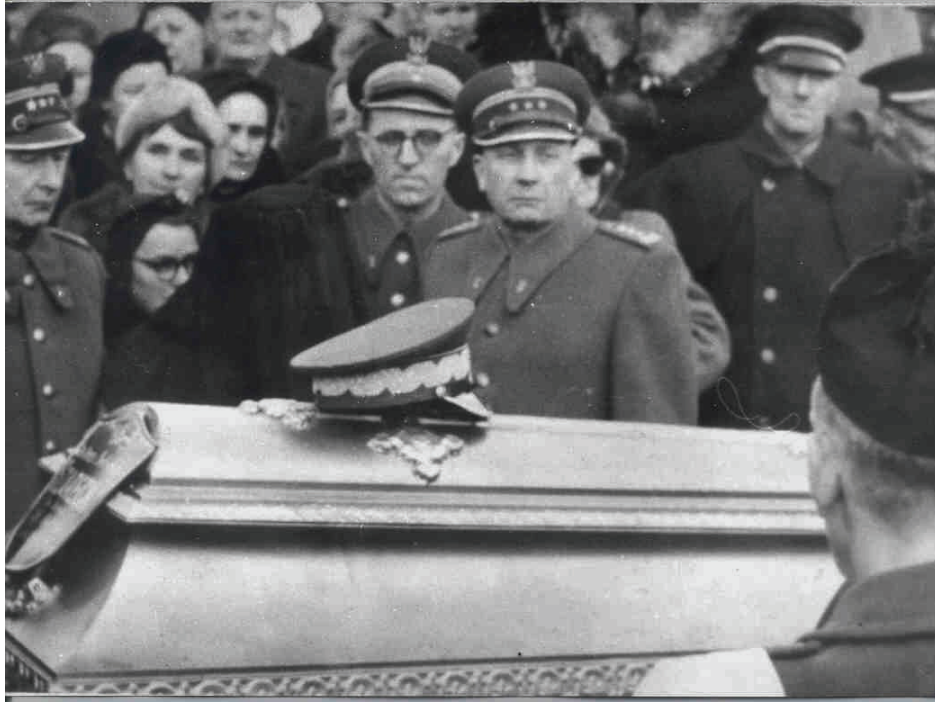
Fot. 21: Pogrzeb Gen B. Szareckiego.