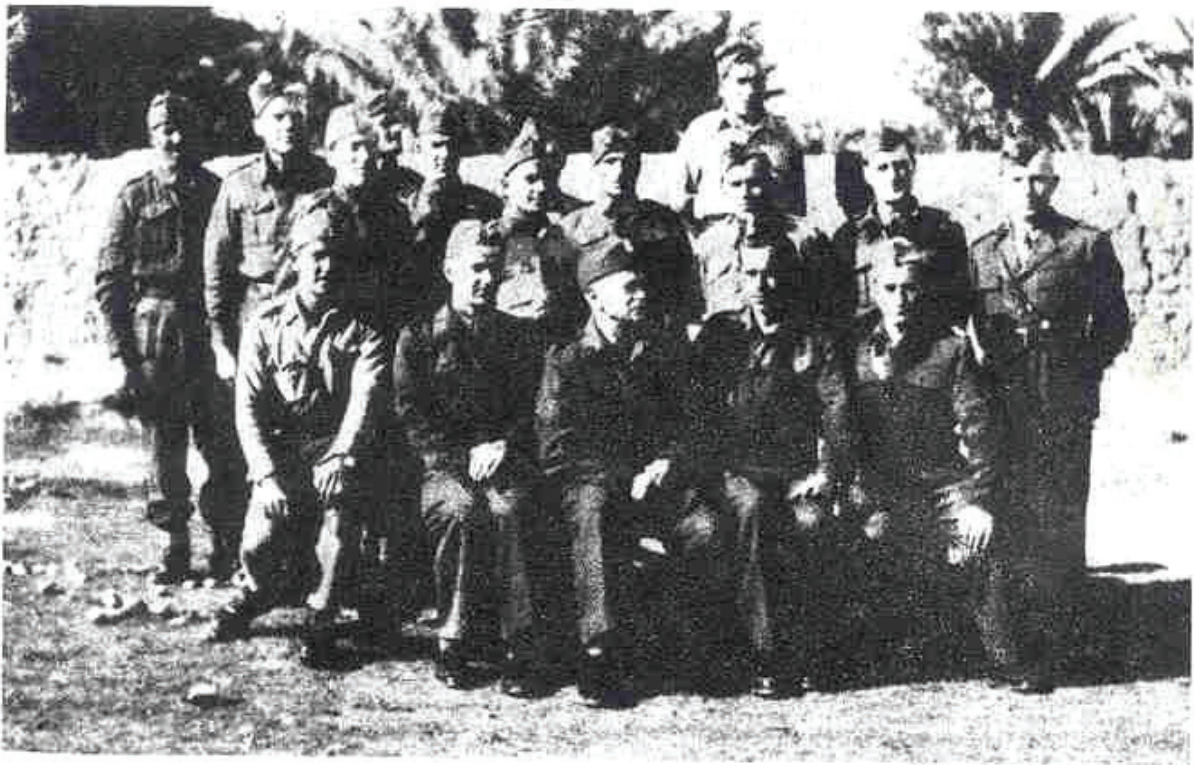
Fot. 7: Grupa oficerów 2 Korpusu Polskiego. Irak, styczeń 1944 r.