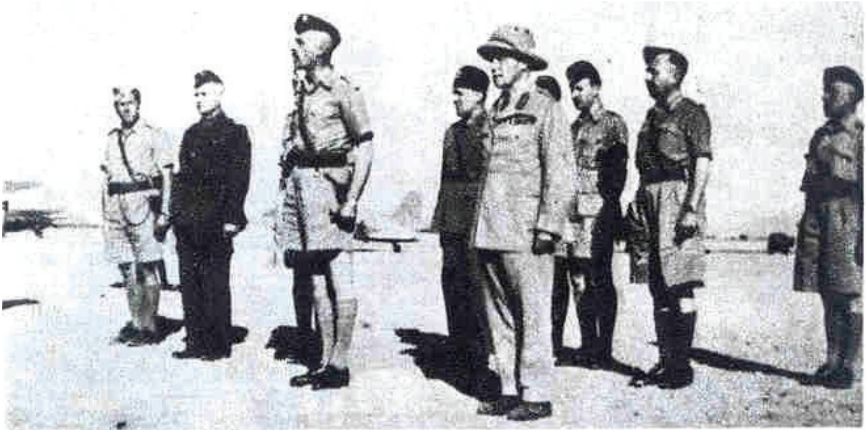
Fot. 6: Dowódca armii gen. Władysław Anders wraz z wyższymi oficerami Armii Polskiej na Wschodzie. Teheran, lotnisko, kwiecień 1942 r.