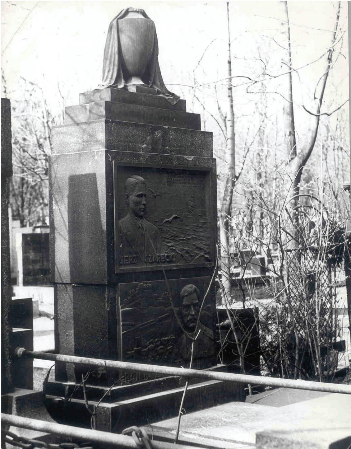
Fot. 23: Pomnik nagrobny Gen. Bolesława Szareckiego