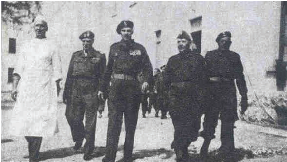
Fot. 10: Dowódca 2 Korpusu Polskiego gen. Władysław Anders wizytuje Szpital Wojenny nr 5 w Cassamassima. Włochy, czerwiec 1945 r.