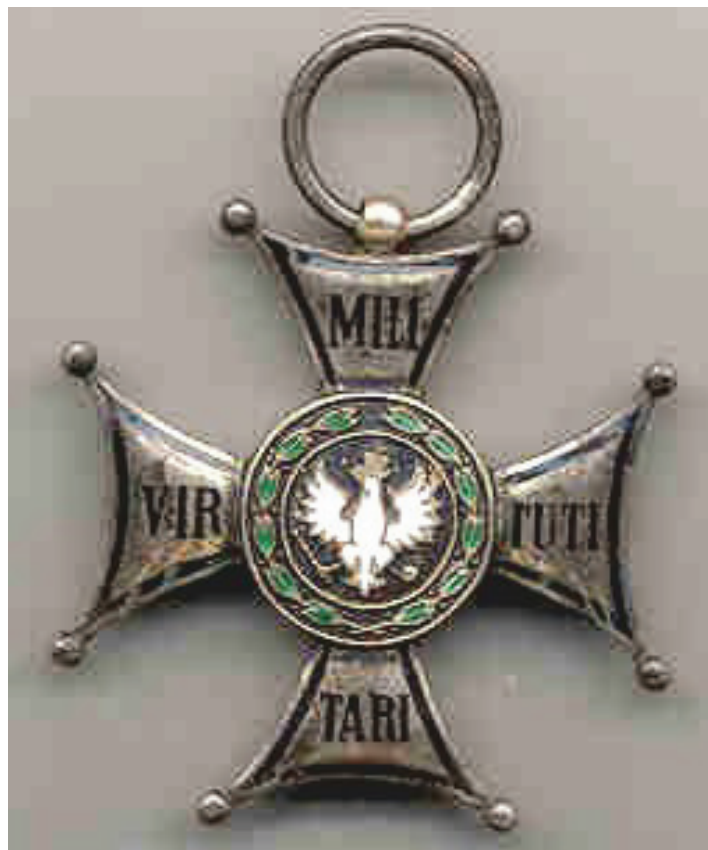
Fot. 17, 18 i 19: Order Virtuti Militari przyznany B. Szareckiemu