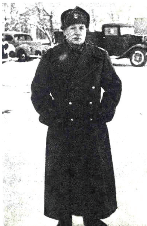
Fot. 5: B. Szarecki